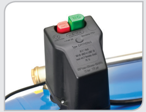
Componentes de referencia Telepresostatos marca NE-MA (P≥5,5 HP).