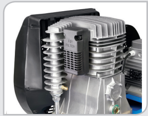
Cabezales Serie P Excelente rendimiento: cilindro de hierro fundido con envoltente de aluminio.

Amplia gama para adecuarse a cada aplicación: Potencia desde 2 HP hasta 10 HP y calderines de 50/100/270 Lt en los modelos portátiles y de 270/500 Lt en los modelos estacionarios.