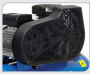
Protector de correas en polipropileno Bajo nivel sonoro y excelente refrigeración.